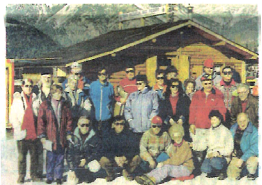
Amarcord: le prime esperienze trent'anni fa