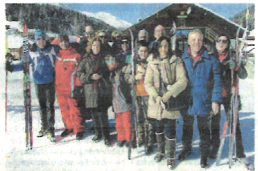
Oggi sugli sci, la stessa passione dopo tanti anni